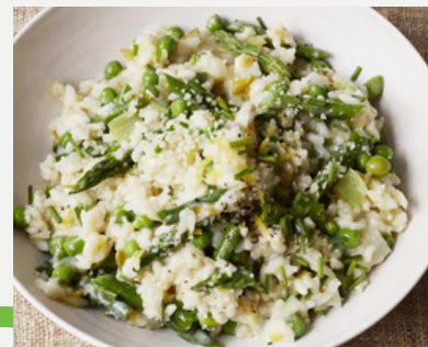
RISOTTO DE PRIMAVERA