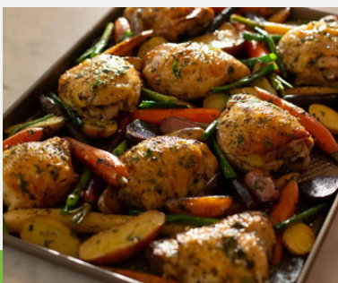
CENA DE POLLO PRIMAVERAL EN BANDEJA DE HORNO