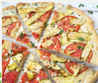
PIZZA DE CALABACÍN, RICOTTA Y LIMÓN